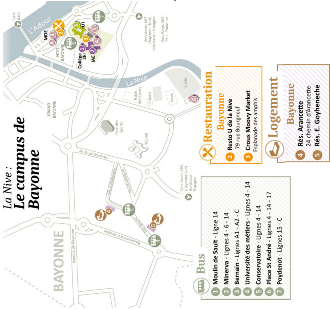
FIG. 8.1 : Plan du campus de la Nive