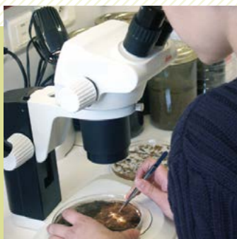
Identification des invertébrés